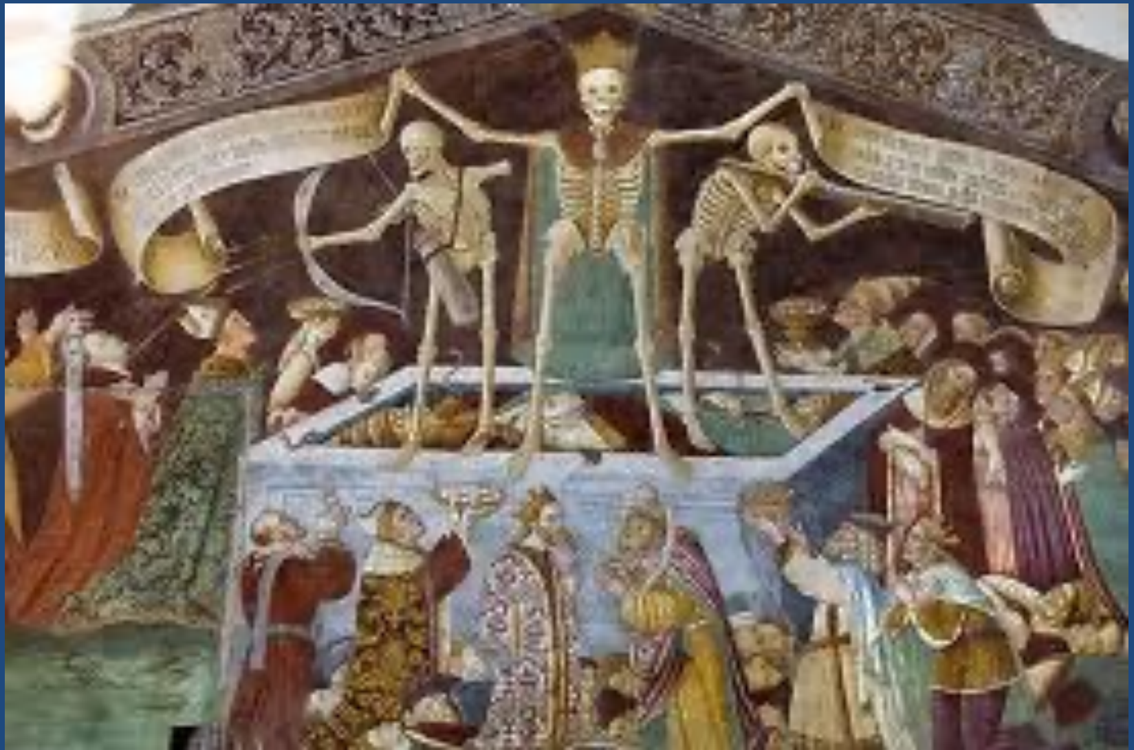
Clusone, oratorio dei Disciplini, Il trionfo della morte