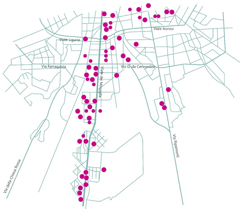
Distribuzione delle "realta' sociali" nel Municipio 5