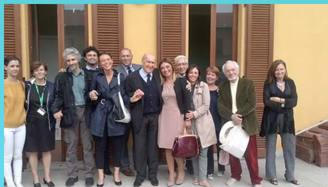
La visita del Prof. U. Veronesi all'Hospice Cascina Brandezzata