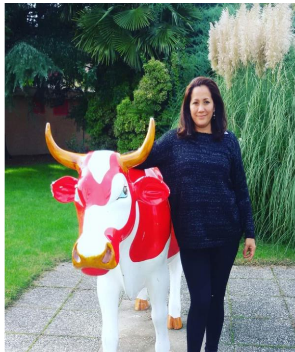
Foto alla fabbrica del cioccolato

Purtroppo anche con questo uomo la relazione finisce, credevo fosse l'uomo dei miei sogni ma purtroppo con un tradimento tutto finisce, ed io mi ritrovo di nuovo sola con tutti i miei problemi, cerco di reagire, ma spesso le lacrime la tristezza e la rabbia prendevano il sopravvento.