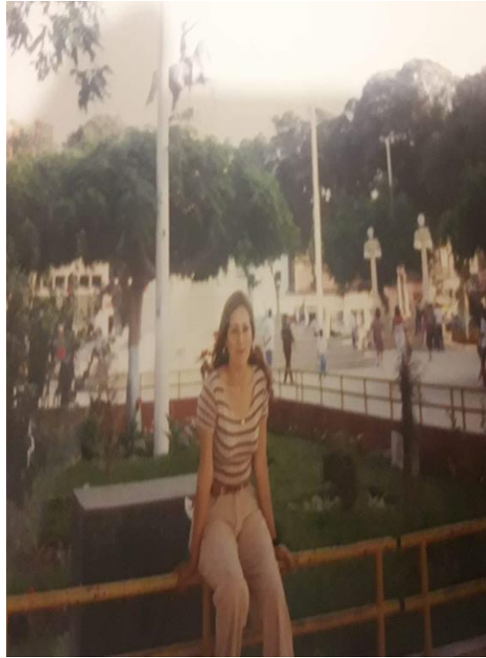
I Prima di venire in Italia