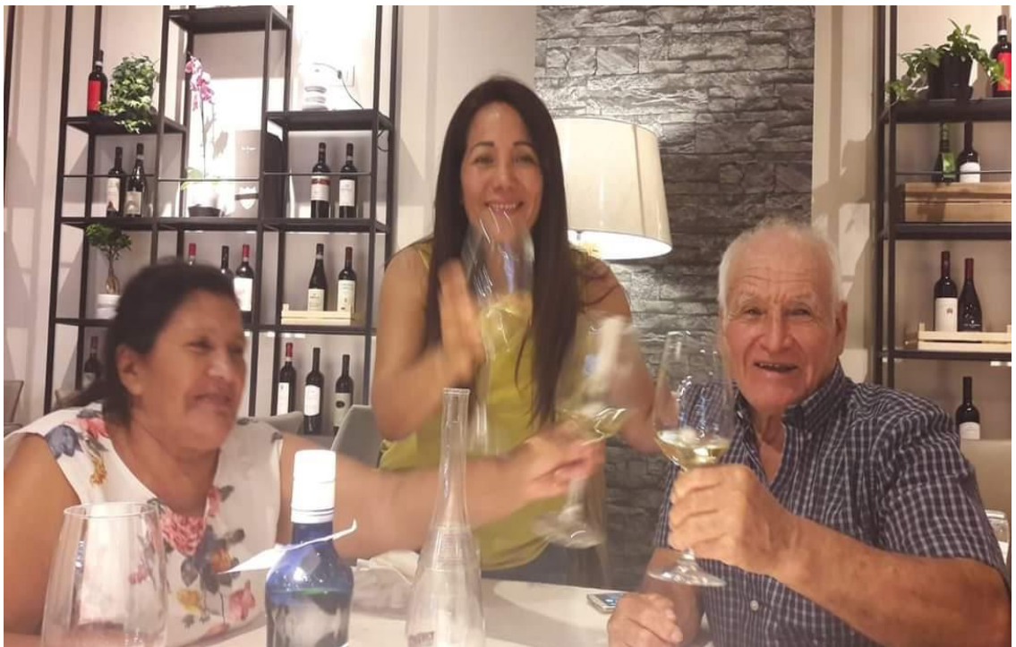
I miei genitori che 4 anni fa sono venuti a trovarci in Italia.