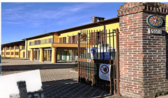
Come è (l'Hospice)