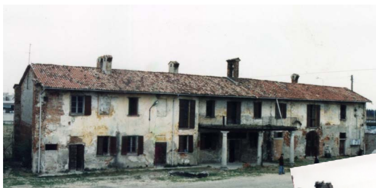
Come era (la Casa padronale)